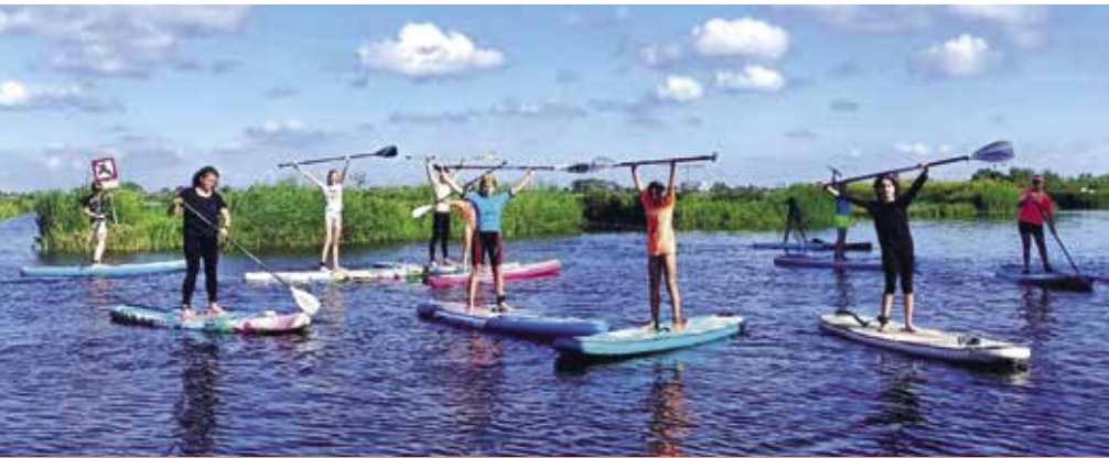
Gezellig samen suppen tijdens de zomeractiviteiten