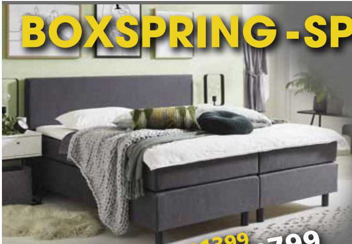
Boxspring V620 incl. topper