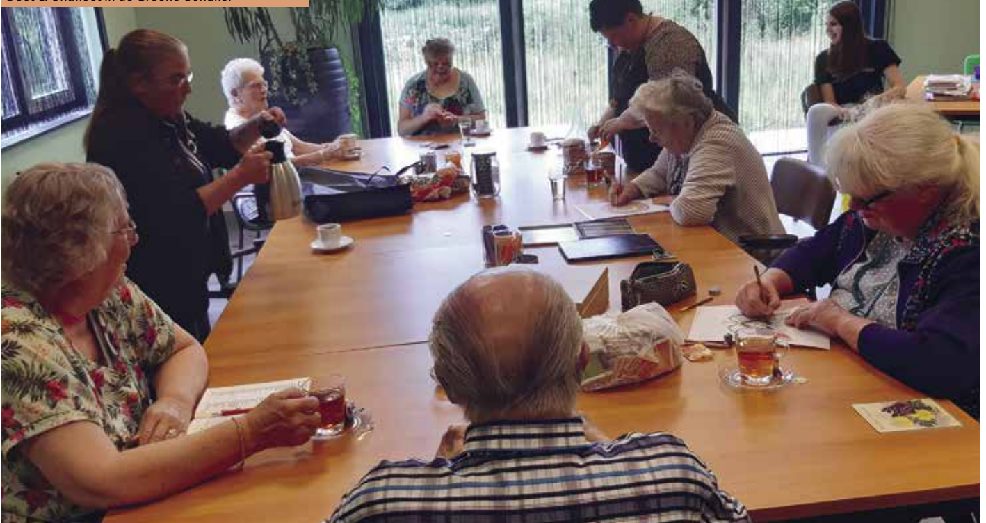
Doet & Ontmoet in de Groene Schakel

Wie één van de middagen voor het eerst wil bezoeken (op dinsdag in De Groene Schakel en op donderdag bij Loet 10) kan zich aanmelden bij het Servicepunt: tel. 0224-291042, zodat het niet al te druk gaat worden. Mailen naar t.niesten@wonenpluswelzijn.nl mag ook. De toegang is gratis en een kopje thee of koffie kost slechts 1 euro. Dus... graag een potje sjoelen of gewoon gezellig een praatje maken? Heeft u zelf nog leuke ideeën om te doen? In een ontmoeting ligt het begin. ■